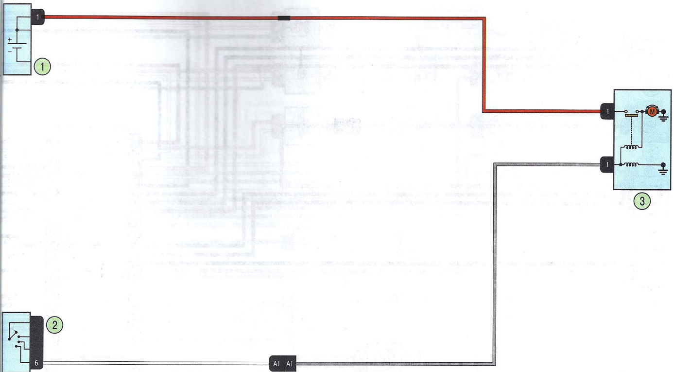
Схема 1. Система пуска двигателя K4M: 1 – аккумуляторная батарея; 2 – выключатель (замок) зажигания; 3 – стартер