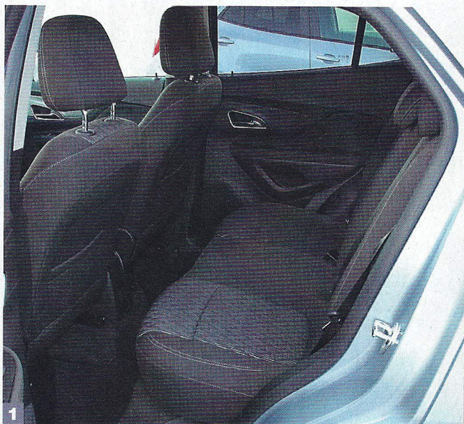
1. Места по длине достаточно, чтобы водитель ростом 180 см свободно уселся «за собой»

водителя в переключении режимов не предусмотрено. Система достаточно умна, чтобы адекватно распределять крутящий момент, — мы в этом убедились во время первого тест-драйва. Мокрые ▶