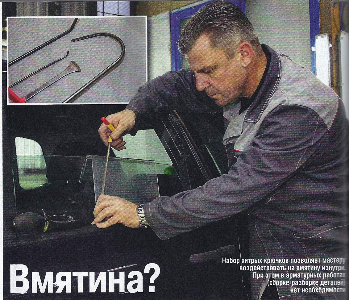
Набор хитрых крючков позволяет мастеру воздействовать на вмятину изнутри. При этом в арматурных работах (сборке-разборке деталей) нет необходимости